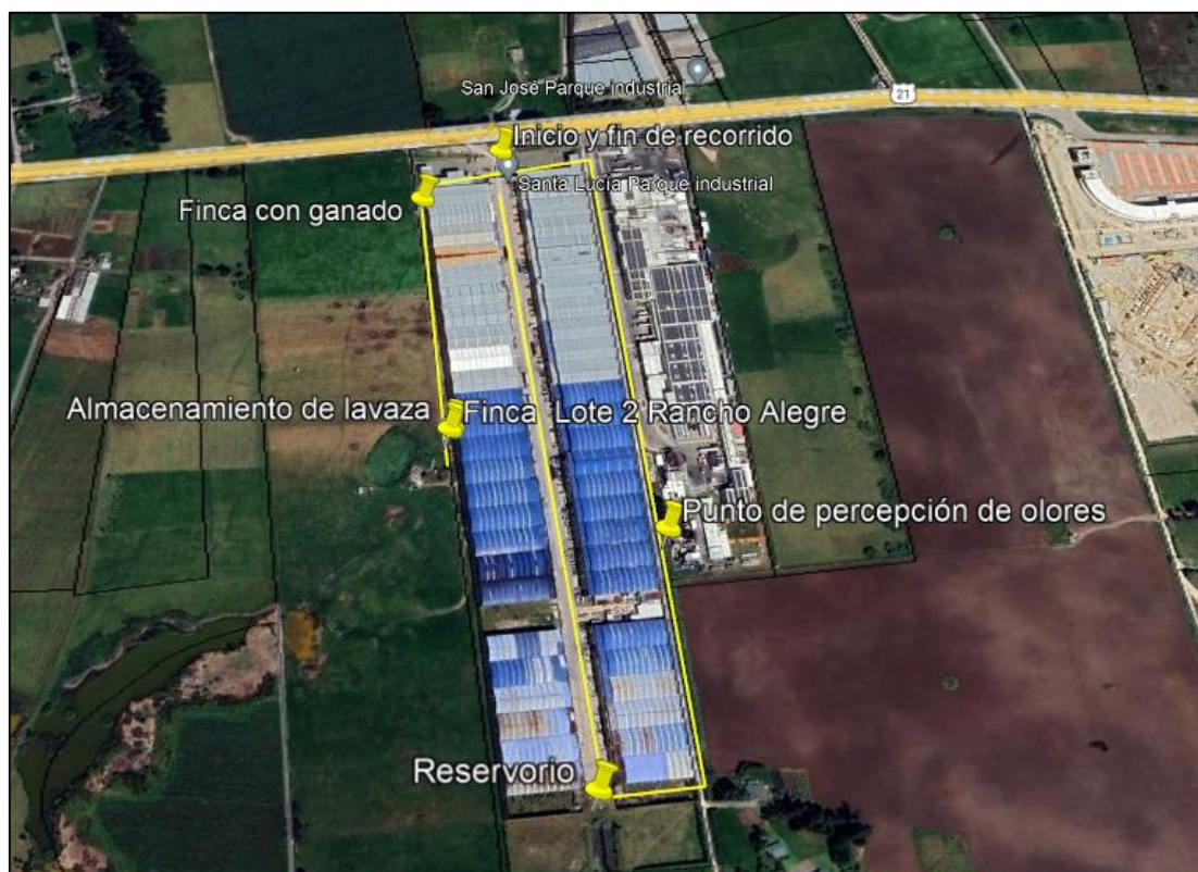
Ilustración 1. Recorrido visita técnica olores ofensivos