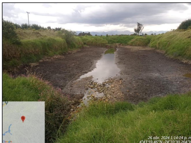
Ilustración 2. Reservorio

Posterior a ello, se avanzó en el recorrido de verificación sobre la vía que colinda con el parque Industrial y la empresa Pepsico, percibiendo olor similar a materia orgánica en descomposición sobre las coordenadas 4°44'7.344"N y 74°10'33.36" W, el cual es semejante al olor que se distinguió en las bodegas 12, 13, 16, 17, 18 y 19, observándose planta de tratamiento de aguas residuales de la empresa Pepsico.