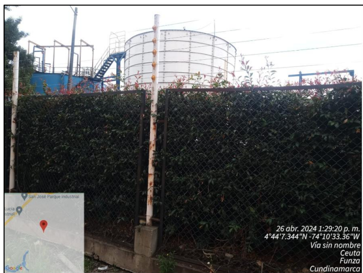
Ilustración 3. Punto de percepción de olores ofensivos

Posterior a ello, se avanzó en el recorrido de verificación sobre la vía que colinda con el parque Industrial y la empresa Pepsico, percibiendo olor similar a materia orgánica en descomposición sobre las coordenadas 4°44'7.344"N y 74°10'33.36" W, el cual es semejante al olor que se distinguió en las bodegas 12, 13, 16, 17, 18 y 19, observándose planta de tratamiento de aguas residuales de la empresa Pepsico.