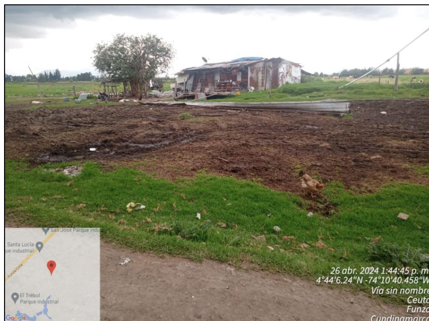
Ilustración 6. Finca Lote 2 Rancho Alegre

C.P. 250020 Tel. +57(1) 823 40 70 823 40 71 / 823 40 73 Fax. + 57(1) 825 76 20 Dir. Cra. 14 No. 13-05