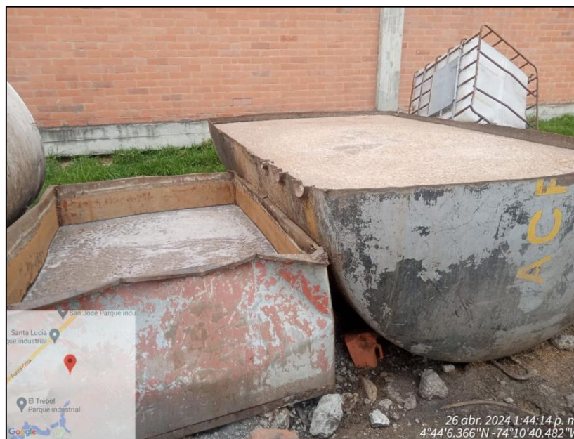
Ilustración 7. Almacenamiento de lavaza

Se observa sobre este mismo predio en las coordenadas 4°44'6.366"N y 74°10'40.482" W almacenamiento de lavaza en donde se percibe olor característico del proceso de fermentación.